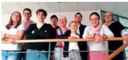
> enfance jeunesse / p.10-12 Le CMJ