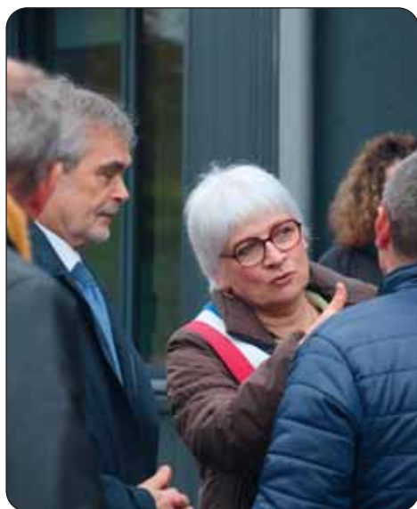
Mme le Maire lors de l'inauguration.

L'opération, d'un montant total de 526 666 €, a été subventionnée à hauteur de 90 000 € au titre de la DETR et 8 800 € au titre de la rénovation énergétique ACTEE+. L'autofinancement communal s'élève donc à 427 866 €.