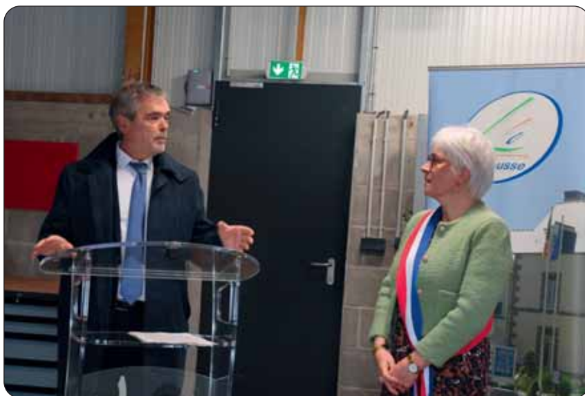
Le sous-préfet de Fougères-Vitré Gilles Traimond avec Mme le Maire.