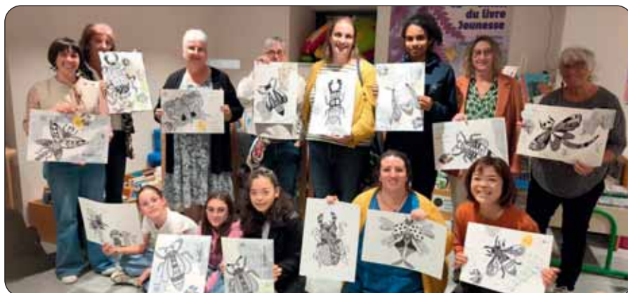
L'atelier créatif ados/parents du 17 octobre dernier.

Une séance V.I.P. petite enfance aura lieu le jeudi 29 janvier, de 9 h 30 à 11 h. C'est une ouverture de la médiathèque réservée aux professionnels de la petite