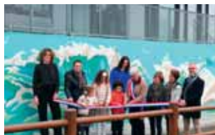
> actualités / p.4-9 La fresque

Journal municipal - # 160 - Décembre 2025