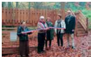
> actualités / p.4-9 La cabane perchée