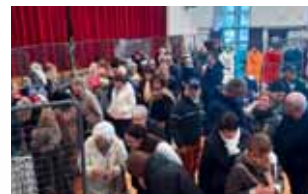
> services / p.13-16 Le marché de Noël