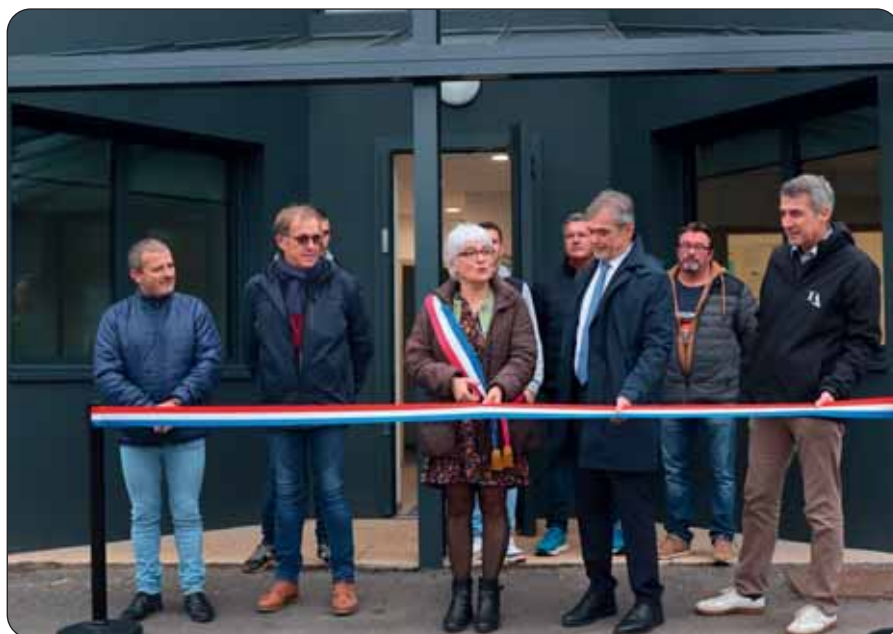
Le traditionnel coupé de ruban.

Le sous-préfet a mis en avant « le caractère innovant d'un bâtiment économe en énergie, alliant rénovation, extension et respect des contraintes foncières ». Il a également souligné l'aspect collaboratif du projet : « Ce bâtiment est le fruit d'un véritable travail conjoint entre l'architecte et les