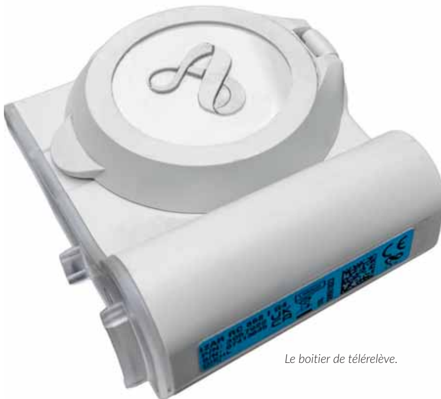
Le boîtier de télérelève.

anomalie sur le compteur et pourra ainsi vous en informer directement